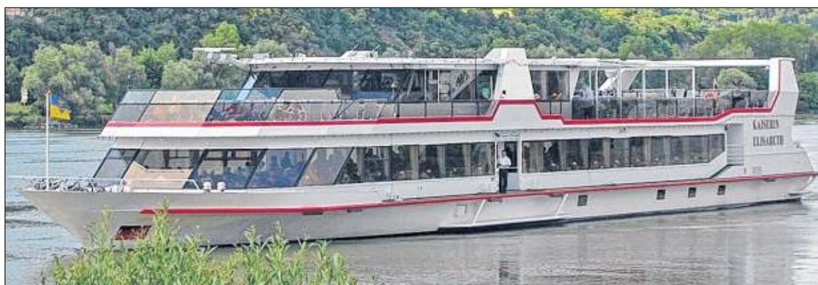
57 Meter lang, 10,63 Meter breit: Die Kaiserin Elisabeth fasst bis zu 600 Passagiere.