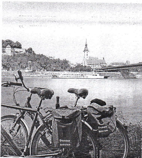
Kleine Pause mit Blick auf Bratislava.