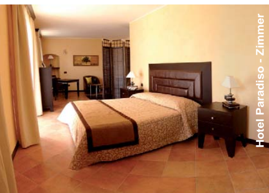
Hotel Paradiso - Zimmer