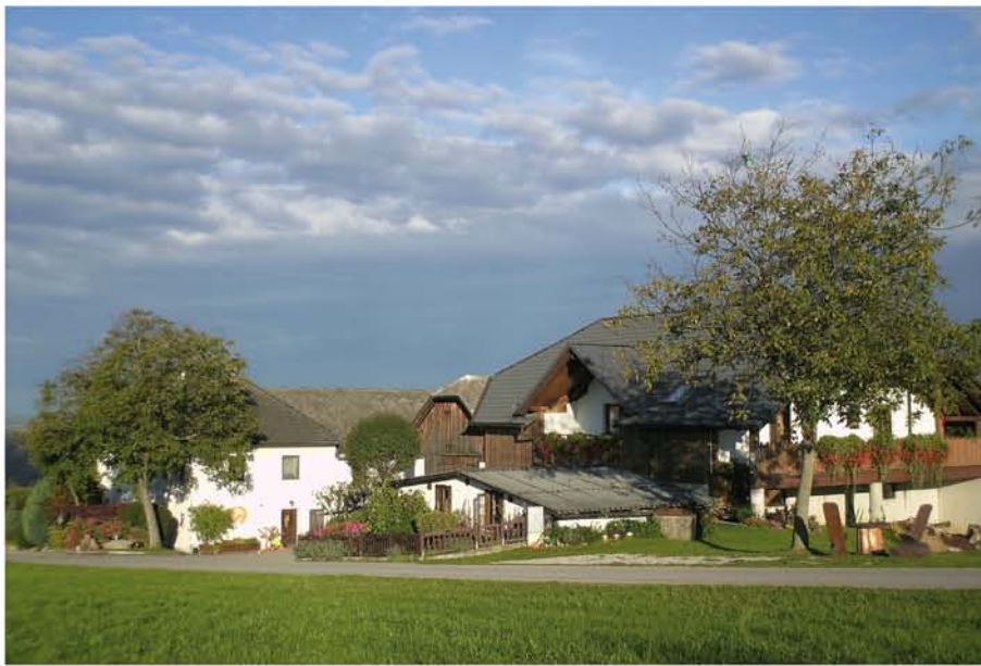
Ihr Bauernhof bei Mitterkirchen

Lust auf gesunde Landluft und echte Gastfreundschaft? Dann ist diese Radwoche genau das Richtige für Sie. Hier erleben Sie die unvergleichliche Donaulandschaft und die Gemütlichkeit der Einheimischen in den verschiedenen Regionen hautnah.