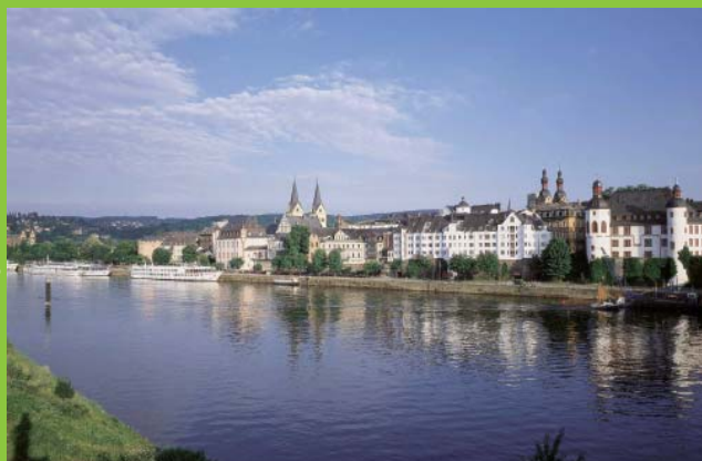
Koblenz - Moselpromenade

So, 4. Juli - Per Bahn bis Amsterdam-CS; Boarding im Zentrum ab 15 h. Montag - Auf Nebenarmen des Rheins bis Arnhem (15 h). Dienstag - Schiff bis Emmerich; Rheinradweg bis Wesel; Schiff bis Düsseldorf (20 h). Mittwoch - Rad bis Dormagen; Schiff bis Köln (Rundgang ab 17 h). Donnerstag - Schiff bis Linz/Rhein; Rad bis Koblenz (17 h). Freitag - Rad bis Bacharach; Schiff bis Mainz (17 h). Samstag - Schiff bis Frankfurt, Mainradweg sehr schön bis Aschaffenburg (an 19 h). Sonntag - Ausschiffung und Heimfahrt per Bahn.