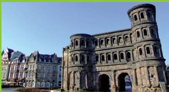
Trier - Porta Nigra

1. Tag - Nach Trier; per Rad zu den vielen Sehenswürdigkeiten. Willkommensmenü. 2. Tag (49 km) - Per Bahn nach Mettlach; am Saarradweg vorbei an Saarburg retour. 3. Tag (38 km) - Per Bahn nach Wellen; am Moselradweg sehr schön durch Weingärten retour. 4. Tag (62 km) - Ins Gebiet der zahlreichen Moselschleifen und nach Trittenheim, retour bis Schweich; zurück per Bahn nach Trier. 5. Tag - Abreise.