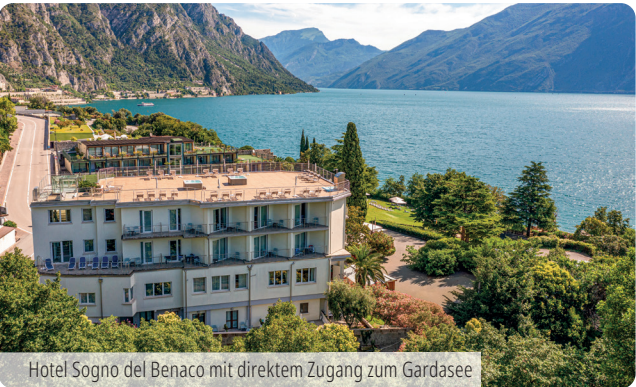
Hotel Sogno del Benaco mit direktem Zugang zum Gardasee

Komfortables Hotel in ruhiger Top-Lage mit 33 Zimmern und Panorama-Dachterrasse mit zwei Whirlpools. Klimatisierte Standard-Zimmer (15-19 m 2 , Gartenblick) mit moderner Ausstattung, WLAN und Terrasse. Schattiger Garten und direkter Seezugang. Innen- & Außenpool im Schwesternhotel nutzbar. Geschäfte und Restaurants befinden sich nur wenige Gehminuten vom Hotel entfernt.