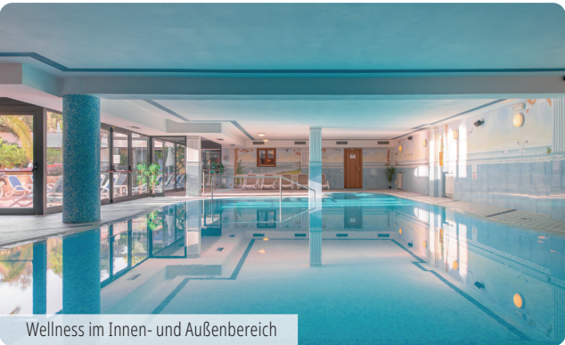
Wellness im Innen- und Außenbereich